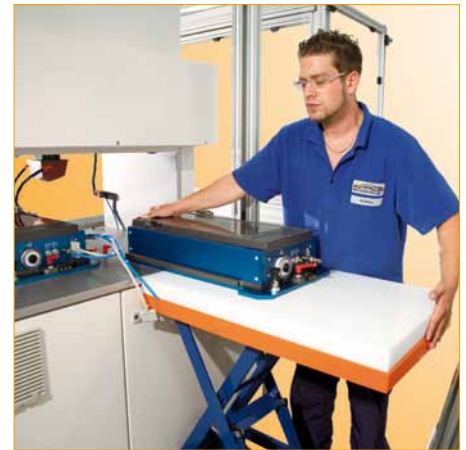
Illustration : Remplacement de la "Vario-Unit" au dos de la machine à l'aide de la "Service Unit" (volume de livraison)