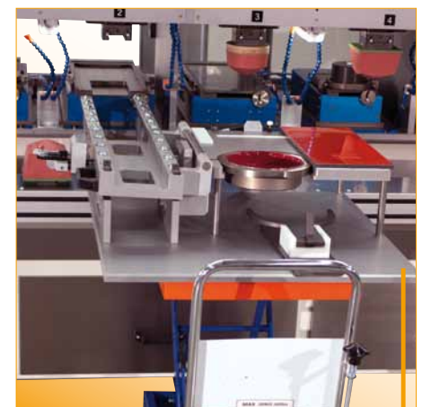
Fig. : "Cliché Unit 210" (option) - Auxiliaire de montage pour remplacer cliché/encre

Les unités "Pad Unit" (poussoir) en deux versions (pneumatique, voire entraînée par servo vérin) et "Drive Unit" (mouvement poussoir pièce à imprimer cliché et retour), également en deux versions (pneumatique, voire entraînée par servo vérin), complètent la "Basic Unit".