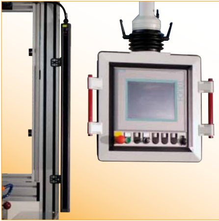
Illustration : "Programming Unit" avec panneau à écran tactile