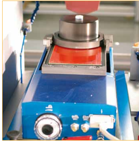
Illustration : "Vario-Unit" au choix Ø 90, 130, 210 mm