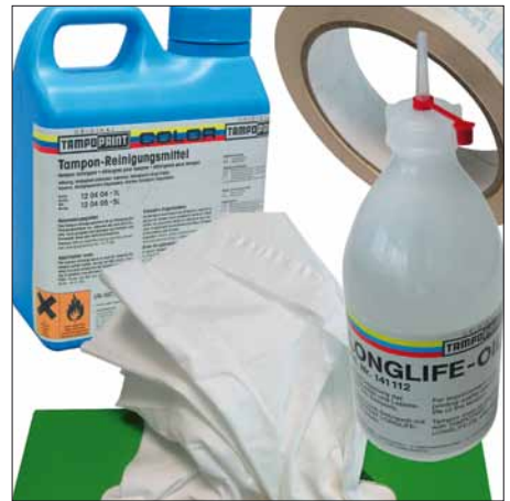
Image: Consommables pour soigner les tampons

Sous réserve de toutes modifications ! ©Copyright