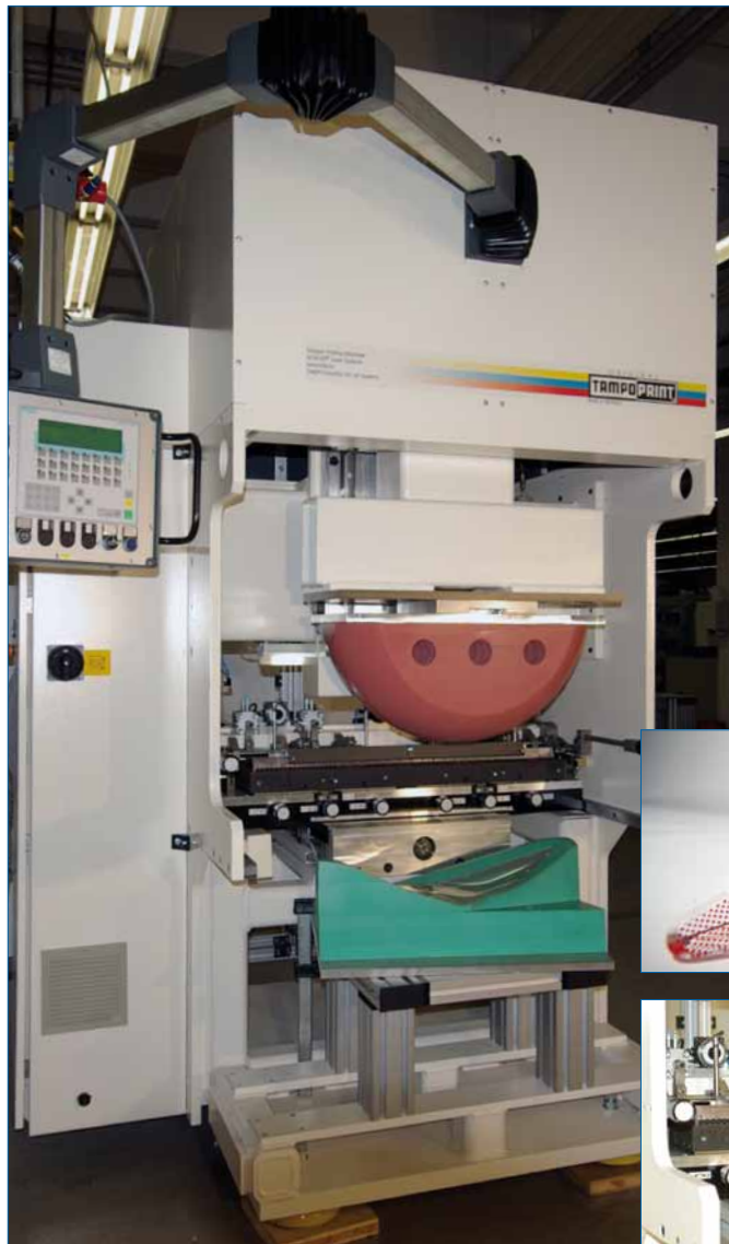
Imagen: Máquina de referencia para impresiones a 1 color de cubiertas de faros traseros