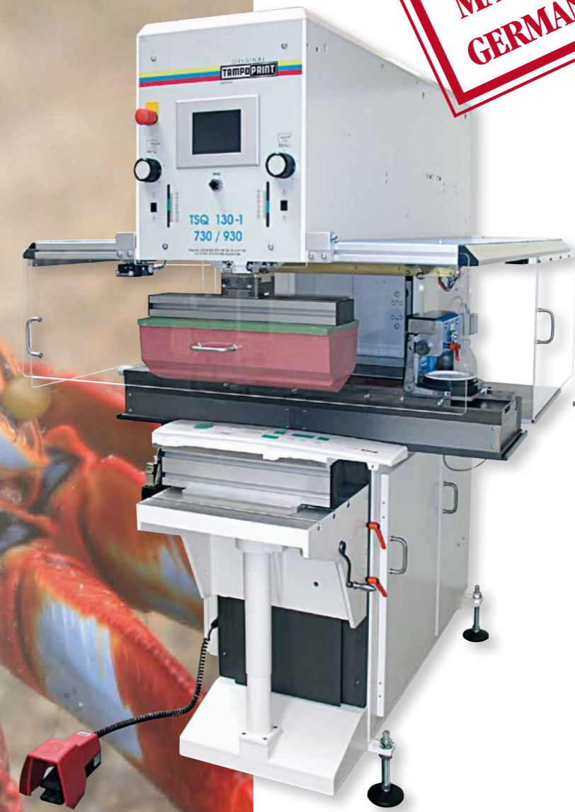
"TSQ 130-1 - 730/930"

Die Möglichkeit, den Querrakelweg auf verschiedene Klischeebreiten (= Druckmotiv) einzustellen, ist ebenfalls Standard.