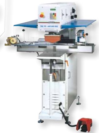
"TSQ 90 - 440/600/800"