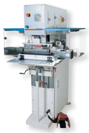
"TSQ 60 - 350/510/710"